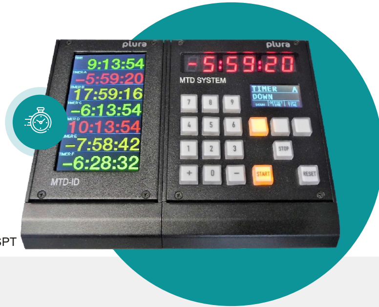
MTD-ID in combination with a SPT