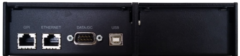
MTD-ID in combination with a SPT