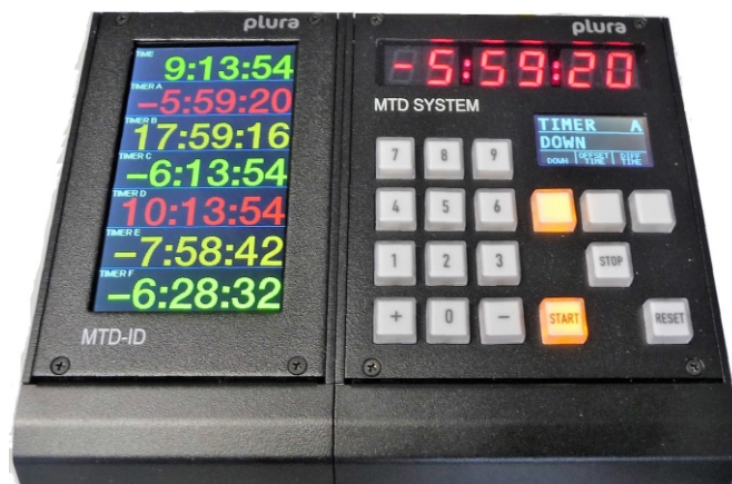
MTD-ID in combination with a SPT